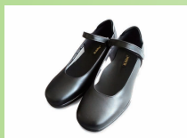
BL902 ¥22,000 カラー ブラック