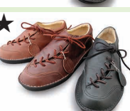
★ G9912Y ¥25,300 カラー ブラック ダークブラウン ブラウン