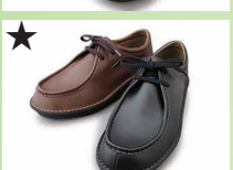
★ G7724 ¥22,000 カラー ブラック ブラウン