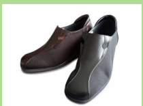
BL209 ¥20,900 カラー ブラック ダークブラウン

ポロナーゼ・リラックスシリーズは、靴を袋状に縫製する伝統的な『ポロナーゼ製法』で作られた、返りが良くフィット感のあるパンプです。底は『RBセラミックソール』で滑りにくくなっています。※滑らないことを保証するものではありません。凍結したり濡れた路面での歩行は十分ご注意ください。