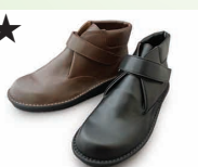
★ G7749 ¥26,400 カラー ブラック ダークブラウン