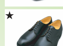
★ プレイントウ 35P40/50/60 ¥30,800 カラー ブラック