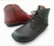
G7748 ¥25,300 カラー ブラック ダークブラウン