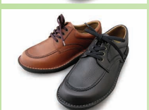
G7721 ¥20,900 カラー ブラック ブラウン