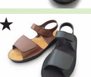
★ LXS-50 ¥16,500 カラー ブラック ブラウン

メンズサイズは24.0～27.0、28.0cmとなります。なお、28.0cmは表記価格+1,100円となります。