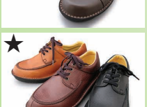
★ G7741 ¥23,100 カラー ブラック ダークブラウン ブラウン