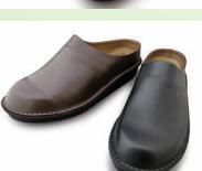
LXS-18 ¥16,500 カラー ブラック ダークブラウン