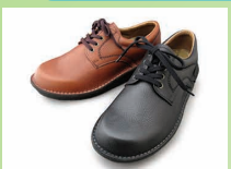
G7720 ¥20,900 カラー ブラック ブラウン