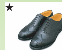
★ ウィングチップ 35W40/50/60 ¥30,800 カラー ブラック

グッドイヤー製法で製作した品質にこだわった最高クラスのビジネスシューズ。幅広・甲高の方向けのモデルです。