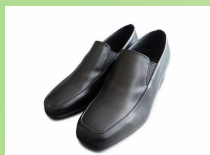
BL258 ¥22,000 カラー ブラック