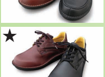
★ G8850 ¥23,100 カラー ブラック ダークブラウン