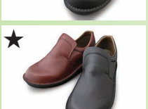
★ G7733 ¥20,900 カラー ブラック ダークブラウン