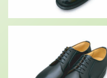
★ プレイントウ TF6040 ¥30,800 カラー ブラック