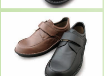
G7726 ¥23,100 カラー ブラック ブラウン ※マジックテープです。