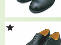
★ ストレートチップ 35S40/50/60 ¥30,800 カラー ブラック

ソールは、グリップカに優れ耐久性の高いラバーソール「タフソール」を採用しております。