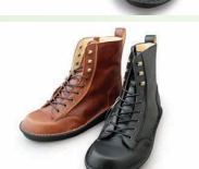
G9920Y ¥30,800 カラー ブラック ダークブラウン ブラウン