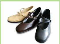
BL906 ¥23,100 カラー ブラック ダークブラウン ベージュ