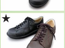
★ G7736 ¥22,000 カラー ブラック ダークブラウン