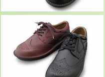
G7729 ¥20,900 カラー ブラック ダークブラウン