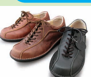
G9911Y ¥25,300 カラー ブラック ダークブラウン ブラウン