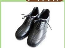
BL340 ¥22,000 カラー ブラック