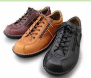
G7737 ¥26,400 カラー ブラック ダークブラウン ライトブラウン ※ファスナータイプです。