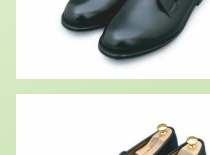
★ コインローファー TF8805 ¥30,800 カラー ブラック ※ラバーソールタイプも有ります。

エステー・リラックス (St.Relax) の特徴 歩き易さをとことん追求したSt.Relaxには、長く歩いても疲れない秘密があります。ビジネス・レジャー等の様々な用途に適し、オールシーズンあなたの足の力強いパートナーとしてお役に立ちます。